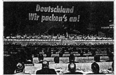
CDU-PARTEITAG IN HAMBURG 20.-23.2.1994

CDU-PARTEITAG 12.-14.9.93 und BÜRGERSCHAFTSWAHL HAMBURG 19.9.1993