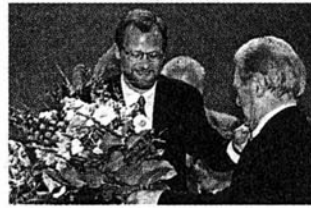
WAHL SCHARPING 25.6.1993

Immerhin veröffentlicht das ZDF überhaupt noch die Ziffern der aktuellen politischen Stimmung. Im „Spiegel“ werden nur die für die Union „schön“ gerechneten Emnid-Ergebnisse verbreitet; von der Dynamik der Meinungsbildungs- und Entscheidungsprozesse der Bürger ist nichts mehr zu erkennen. Glaubt man der „Spiegel“-Kurve, hätte nicht ein einziges Ereignis in den letzten ein-