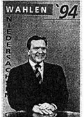
WAHLEN '94 LANDTAGSWAHL IN NIEDERSACHSEN 20.3.1993