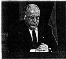
KOHL: ZEHN JAHRE KANZLER 1.10.1992

Kommunalwahlen, vor allem aber Rudolf Scharpings Steuerpläne ließen bei den Bürgern wieder Zweifel an der politischen Kompetenz der SPD aufkommen. Schröders Sympathiebonus war schnell verspielt: Innerhalb einer Woche fiel der SPD-Wert auf das Niveau vor der niedersächsischen Landtagswahl zurück. Die Steuerdiskussion hat der Partei in Verbindung mit den Wahlverlusten von Schleswig-Holstein also doch geschadet; der SPD-Wert liegt nicht mehr – wie vom ZDF behauptet – bei 47, sondern nur noch bei 42 Prozent.